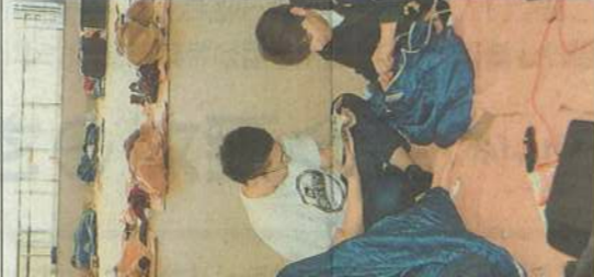
な大雪の影響で、内で一晩を明かした後、新千歳空港

札幌市を中心に北海道で記録的大雪が降った影響で、23日に280便以上が欠航した新千歳空港では、